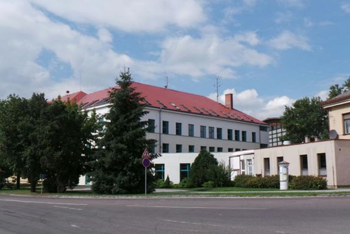
Základní škola a Mateřská škola Krčín Nové Město nad Metují