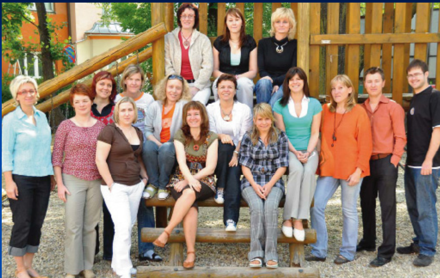
Pedagogický sbor školy